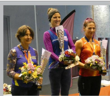
14 H 50 Un magnifique podium féminin au terme d'une course épuisante notamment au petit matin quand la température était au plus bas.

La copie, la reproduction et la diffusion sont soumis aux droits d'auteurs et nécessitent une déclaration préalable, conformément aux dispositions du code de la propriété intellectuelle. (Art L.335-2 et L.335.3)